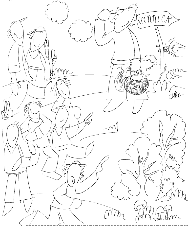
Tu zegnij najpierw - do rodka

WYSZEDŁSZY PONOWNIE OKOŁO ④ GODZINY SZÓSTEJ I DZIEWIĘTEJ, TAK SAMO UCZYNIŁ.