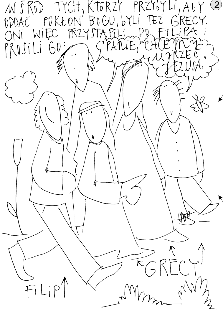
Ewangelia na niedzielę 21.03.2021r. J 12,20-33