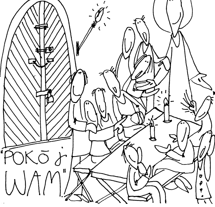
Ewangelia na niedzielę 11.04.2021r. J 20,19-31

WIECZOREM W DNIU ZMARTWYCHWSTANIA, TAM GDZIE PRZEBYWALI UCZNIOWIE, CHOĆ DRZWI BYŁY ZAMKNIĘTE Z OBawy PRZED ŻYDAMI, PRZYSZEDŁ JEZUS, STANĄŁ POŚRODKU I RZEKŁ DO NICH: