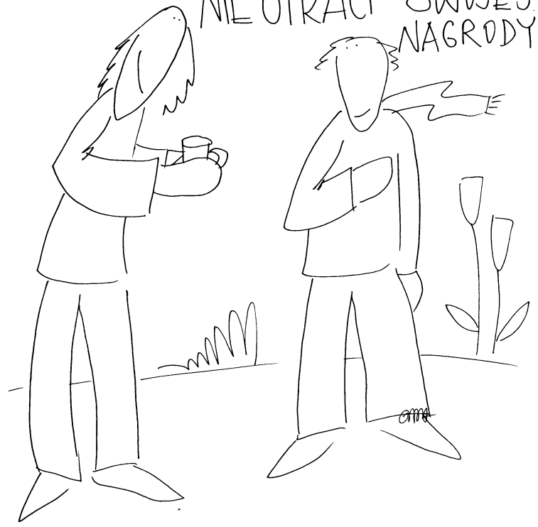
Tu zegnij najpierw - do rodka

⑤ KTO WAM PODA KUBEK WODY DO PICIA, DLATEGO ZE NALEŻYCIE DO CHRYSZTUSA, ZAPRAWDĘ, POWIADAM WAM, NIE UTRACI SWOJEJ NAGRODY.