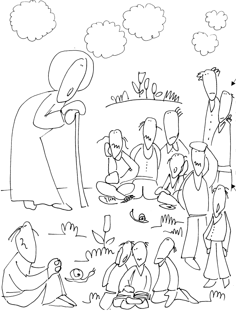
Ewangelia na niedzielę 27.11.2022r. Mt 24:37-44