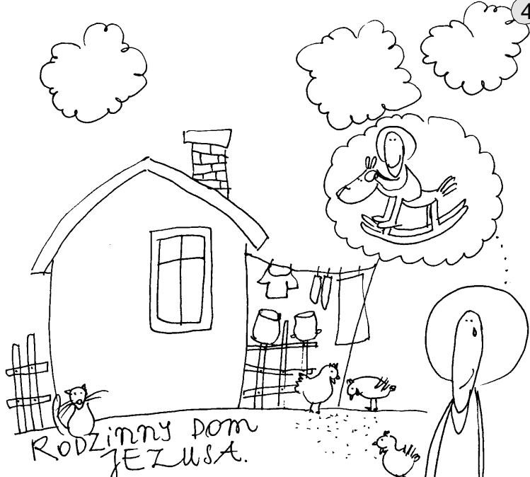
RODZINNY DOM JEZUSA.

PRZYSZEDŁ RÓWNIEŻ DO NAZARETU, GDZIE SIĘ WYCHOWAŁ.